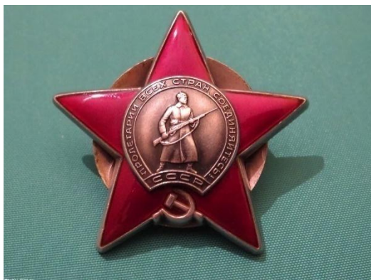
Фото 4 (орден «Красной звезды»)

Прадедуська вспоминал, что особенно сложно было во время отступления, когда бойцы, проходя по деревням, не могли поднять взгляд, на стоявших у плетней женщин, молча смотревших на них. А его мама с двумя сестрами оказалась на оккупированной территории. Сейчас нам трудно представить, что чувствовал эти парни, когда шли в бой с немцами.