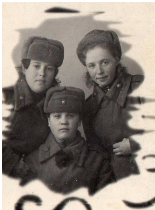
(фотография с боевыми подругами)