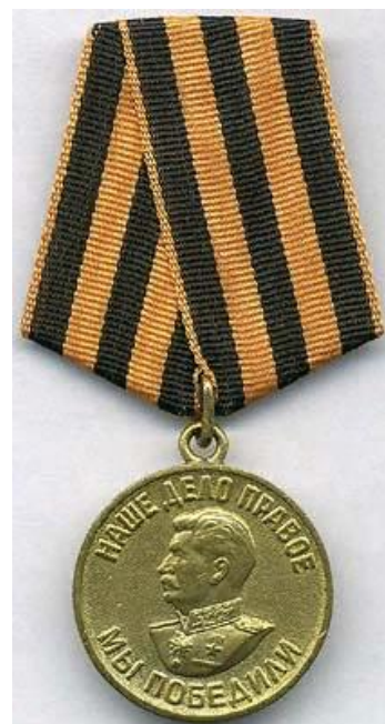
Фото 2 (медаль за победу над Германией)

участником Великой Отечественной войны и прожила с ним долгую жизнь.